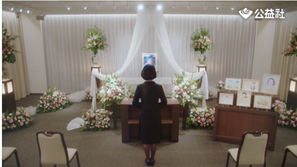
たくさんの絵が飾られている祭壇の前に立つ娘