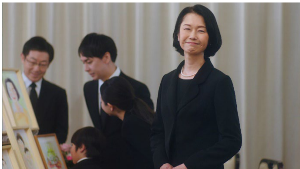
家族で亡き母の思い出を語っていた家族娘は、ずっとよりそってくれた、葬祭ディレクターに清々しい眼差しを送る