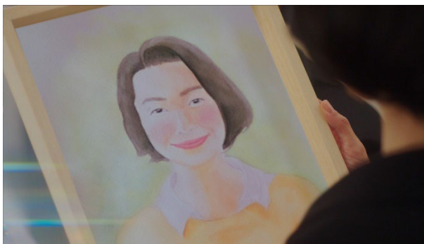
亡き母が描いた、少し前の自分の絵を見入る娘