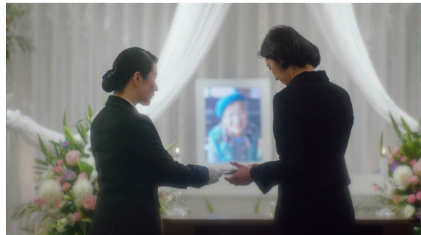
涙ぐむ娘にハンカチを渡す葬祭ディレクター