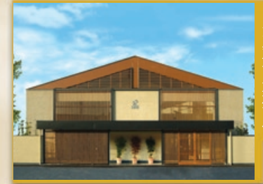
タルイ会館 東加古川