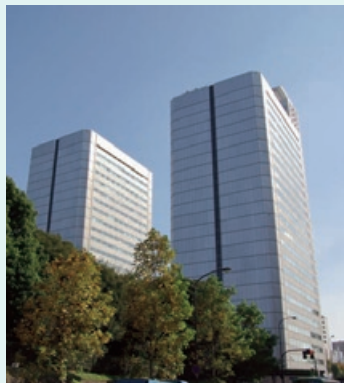
東京本社（平成22年1月1日より） 所在地：東京都港区南青山1丁目1番1号 新青山ビル西館14階