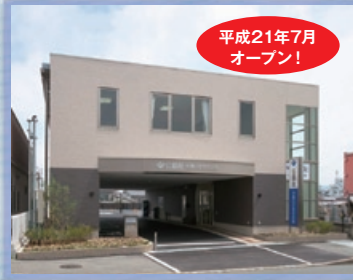
公益社 共善はびきの会館