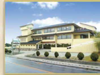
タルイ会館 大久保