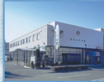
公益社 西宮山手会館