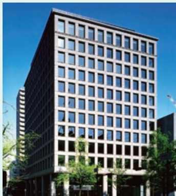
大阪本社（登記本店） 所在地：大阪市中央区道修町3丁目6番1号 京阪神不動産御堂筋ビル8階

また、移転と同時に東京支店を東京本社と改め、今後は東京・大阪両本社制とすることにより当社グループは全国的なネットワーク展開を目指してまいります。