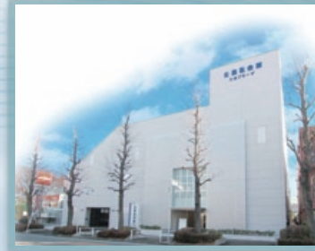
公益社会館 たまプレーザ