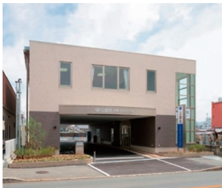
公益社共善はびきの会館

公益社においては平成21年7月、「公益社共善はびきの会館」（大阪府羽曳野市）をオープンいたしました。「公益社共善はびきの会館」は、近鉄南大阪線恵我之荘駅から徒歩8分、府道12号線に面しており、交通至便の地にあります。地上2階建て2階が葬儀専用式場となっており、可動式間仕切りにより、従来のご葬儀から「家族葬」まで様々な葬儀に対応できるようになっております。