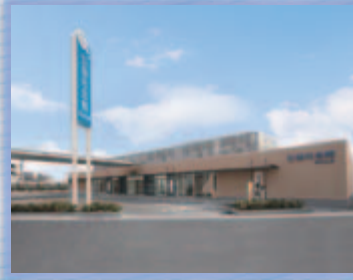
公益社会館 なかもず