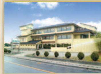
タリイ会館 大久保