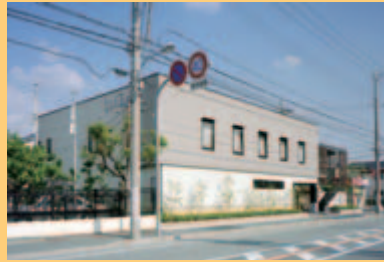
伊丹店 兵庫県伊丹市瑞ヶ丘4-40 ☎072-773-7531