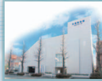
公益社会館 たまプラーザ