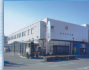
公益社西宮山手会館