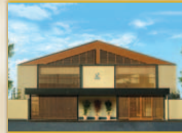
タリイ会館 東加古川