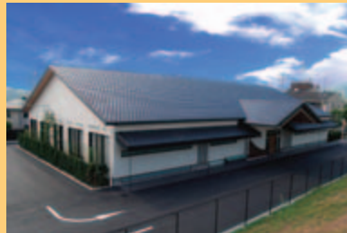
四條畷店 大阪府四條畷市田原台4-6-32 ☎0743-78-7521