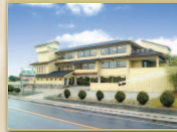
タルイ会館 大久保