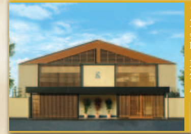
タルイ会館 東加古川