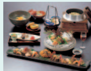
なごみ会席 (税込 3,675円)

「なごみ庵きたはま四條畷店」では、伝統の技とともに、地元契約農家から直接仕入れた新鮮な無農薬野菜や、産地ならではの大地鶏を使用するなど、食材ひとつひとつにもこだわり、お料理を提供いたします。