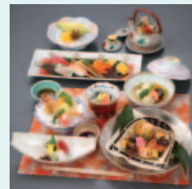
お手ごろ会席 (税込 5,250円)