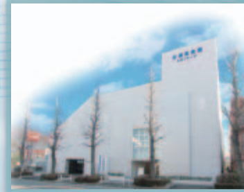
公益社会館 たまプラーザ